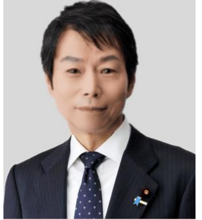
衆議院議員 高木宏壽 事務所のご案内

昨年9月に復興副大臣を拝命してから半年が過ぎようとしております。この間、被災地に足を運び、現場の声を丁寧に伺うと共に、現場主義を徹底し、残された課題解決へ向けて取り組んでおります。東日本大震災の発災から13年が経過し、被災地のニーズは複雑かつ多様化しており、よりきめ細かな対応が必要になっています。今年度は第2期復興・創生期間の中間点であり、引続き、東日本大震災から復興の加速化に向けて、職責を果たしてまいります。